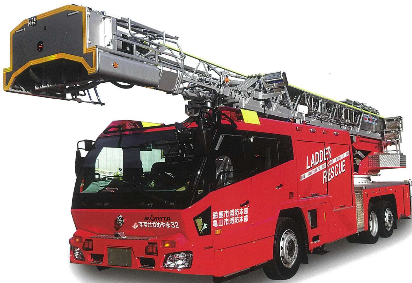
35m級はしご付消防自動車(先端屈折式)